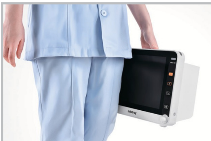
Protección contra caídas