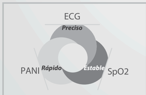
Mediciones esenciales avanzadas