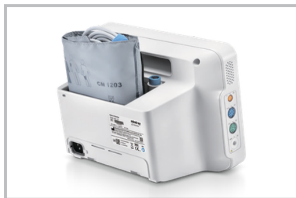
Espacio de almacenamiento