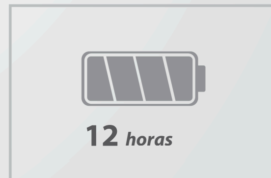
Batería con carga de larga duración